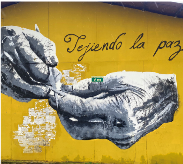
„Frieden weben“: Bild des AETCR La Guajira in Mesetas, das angesichts von Gewaltdrohungen verlegt werden musste.

Ein zentrales Element des kolumbianischen Friedensprozesses mit der FARC-Guerilla bildet die kollektive Wiedereingliederung der ehemaligen Kombattant:innen in eigens dafür eingerichteten „territorialen Reinkorporationsräumen“. Eine Umfrage in sieben ländlichen Gemeinden deutet darauf hin, dass dieser Reinkorporationsprozess zu einem erkennbaren Abbau von sozialer Distanz und Misstrauen in der lokalen Bevölkerung geführt hat und so zur Wiederherstellung des sozialen Zusammenhalts beiträgt. Diese Erfolge sind allerdings begrenzt und – angesichts der andauernden Gewalt in den marginalisierten Regionen Kolumbiens – teils akut gefährdet.