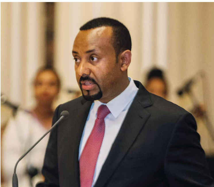
Der äthiopische Ministerpräsident Abiy Ahmed, der 25. Preisträger des Hessischen Friedenspreises.

Am 23. September 2019 wurde der Hessische Friedenspreis der Albert-Osswald-Stiftung zum 25. Mal verliehen. Ausgezeichnet wurde der äthiopische Ministerpräsident Abiy Ahmed. Der Preis würdigt den Mut und die Weitsicht des jüngsten Staatsoberhauptes Afrikas. Kurz nach seinem Amtsantritt am 2. April 2018 beendete er den seit 20 Jahren schwelenden blutigen Konflikt mit dem Nachbarstaat Eritrea. Entschlossen ging er außen- und innenpolitische Reformen an und es gelang ihm eine weitgehende Liberalisierung seines Landes. Der Preis soll ihm Unterstützung sein und Abiy Ahmed darin bestärken, diesen schwierigen Weg weiterzuverfolgen. Wir präsentieren Auszüge aus den Reden bei der Preisverleihung im hessischen Landtag in Wiesbaden.