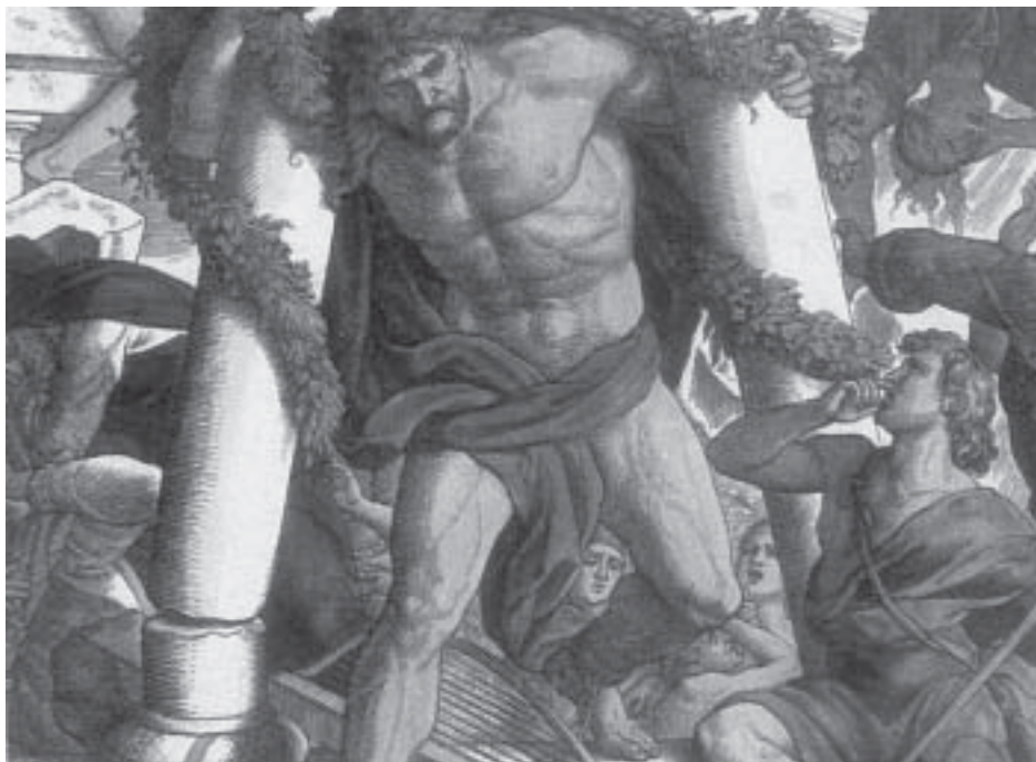
Stürzte die Säulen des Tempels ein und riss 3.000 Philister mit in den Tod: Samson war rund 1200 v. Chr. der erste Selbstmordattentäter in der Religionsgeschichte.