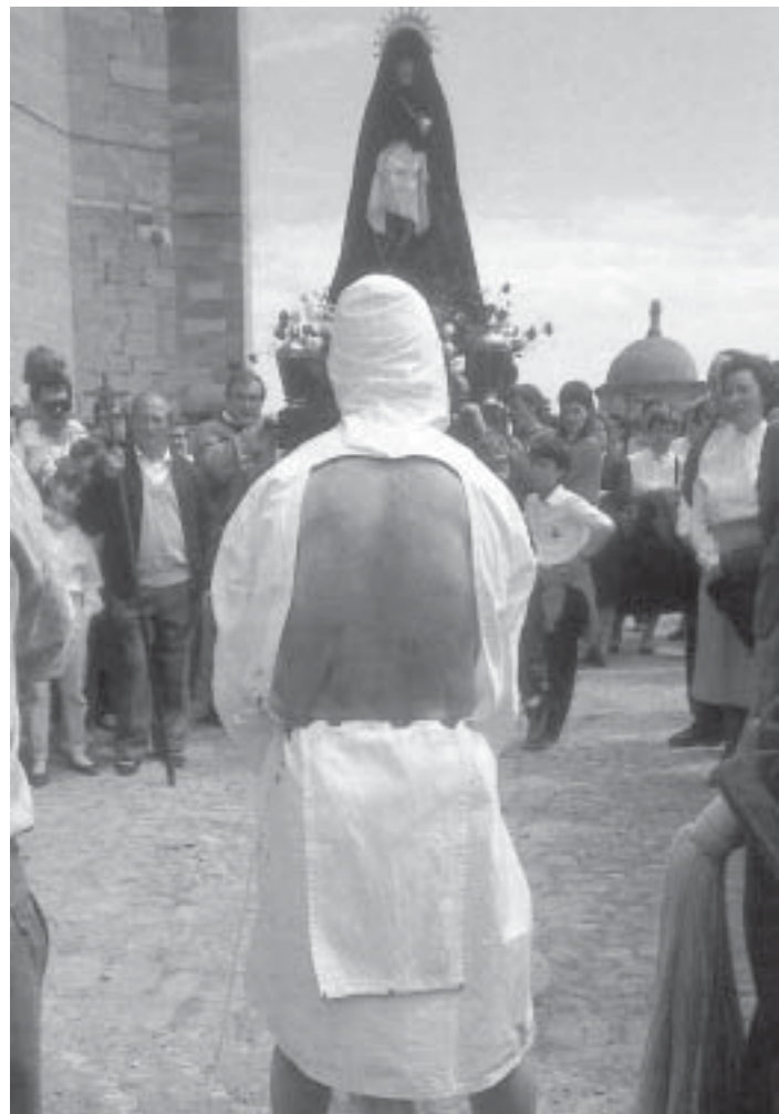
Fanatisches Glaubensbekenntnis: Selbstgeißelung während der Karwoche im spanischen Santa Vicente de la Sonsierra.

ins Paradies“ nach dem Tod als die Erfüllung des Lebens angesehen worden. Je aufgekklärter sich eine soziale Gemeinschaft fühlte, desto mehr trat allerdings die Vorstellung in den Vordergrund, man könne mit wissenschaftlicher Anstrengung dem Paradies auf Erden näherkommen oder gar durch biowissenschaftliche und medizini-