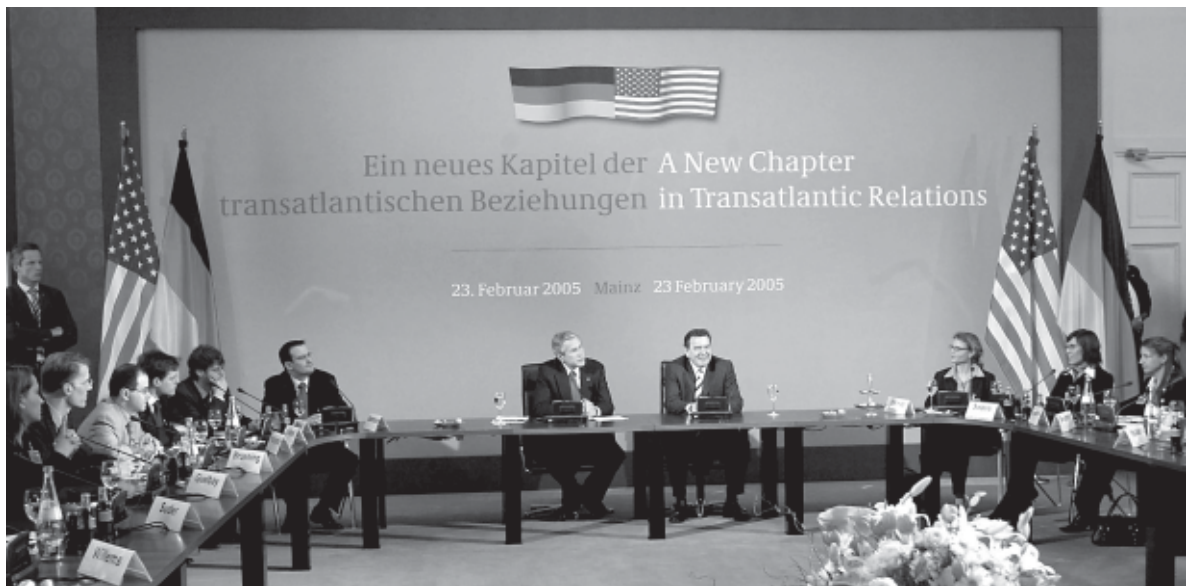
Beim Deutschland-Besuch von Präsident George W. Bush schlagen er und Bundeskanzler Gerhard Schröder „ein neues Kapitel der transatlantischen Beziehungen“ auf. Doch darüber, wie dieses aussehen soll, wurde noch keine Einigung erzielt.

1973 blieb eine Kontroverse aus, da trotz erheblicher Vorbehalte gegen Kissingers Bedingungen insbesondere aus Paris niemand ernsthaft die Vormachtstellung der USA in Frage stellen wollte. Stattdessen ließen sich die Europäer auf eine Reihe von amerikanischen Vorgaben ein. Die so genannte Gymnich-Formel, mit der beide Seiten den möglichen Konflikt beilegte, sah zum einen die fallweise und frühzeitige Unterrichtung der USA durch die EG-Präsidenschaft vor. Zum anderen legte diese Formel fest, dass jedes EG-Mitglied die Freiheit behält, alle Fragen auch bilateral mit den USA zu konsultieren. Damit wurde der Anspruch der Europäischen Politischen Zusammenarbeit als vorrangiger Ort der sicherheitspolitischen Konsultation und Zusammenarbeit ihrer Mitglieder unterlaufen und blieb die Frage offen, ob die NATO oder die EG/EU für die westeuropäischen Länder die zentrale sicherheitspolitische Institution darstellt.