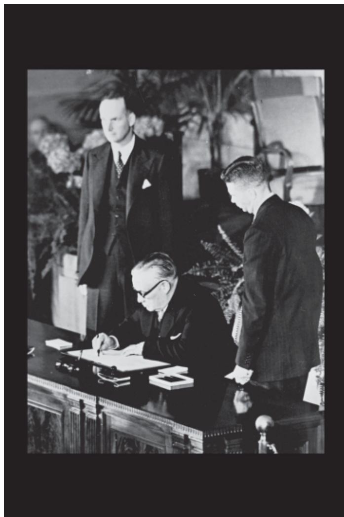
Andere Zeiten: Außenminister Ernest Bevin unterzeichnet 1947 den NATO-Vertrag für Großbritannien. www.nato.int

In der Formulierung einer gemeinsamen Strategie und Politik gegenüber der Sowjetunion näherte sich die Praxis der Konsultationen diesem Ideal weitgehend an. Es entwickelte sich innerhalb der NATO in Bezug auf die Bedrohung durch die Sowjet-