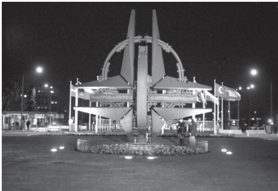
Die NATO – Auslaufmodell oder Sicherheitsorganisation der Zukunft?