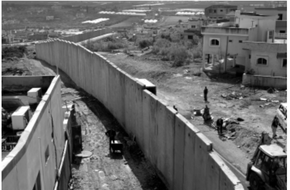
Die Mauer im Westjordanland soll jüdischen Siedlungen Schutz vor palästinensischer Gewalt bieten – so die Erklärung Israels. Allerdings verläuft sie nicht entlang der sog. „Green Line“, den Waffenstillstandslinien von 1949, sondern oftmals weit im palästinensischen Gebiet, das durch sie förmlich „zerschnitten“ wird.

In der Beurteilung der Mauer, die Israel im Westjordanland zu errichten begonnen hat, herrscht unter den Staaten der Welt weitgehend Einigkeit: Sie ist völkerrechtswidrig und wieder abzubauen. Als der Internationale Gerichtshof in Den Haag dies auch offiziell feststellen sollte, zeigten jedoch zahlreiche Staaten eine überraschende Zurückhaltung. Diese Entwicklung nimmt der Autor zum Anlass, um für eine konsequente Anwendung des Völkerrechts zu plädieren. Er legt dar, warum es in jedem Fall anzuwenden ist, und welche Gefahren eine selektive Be- oder Missachtung des Völkerrechts in sich birgt. Marlar Kin