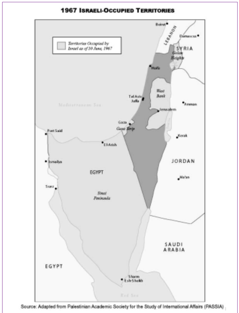
Israel in den Grenzen der Waffenstillstandslinie von 1967. Seitdem sind umfangreiche Gebiete durch neuere Siedlungen hinzugekommen.

Aus diesen Gründen sind die Maßnahmen des Mauerbaus eine Verletzung des IV. Genfer Abkommens und auch der Haager Landkriegsordnung. Diese Verträge tragen dem Sicherheitsbedürfnis der Besatzungsmacht durchaus Rechnung, aber eben nur insofern, als die spezifischen Regeln das vorsehen. Diese Vorschriften stellen bereits einen Kompromiss zwischen den Bedürfnissen der Besatzungsmacht und dem Schutz der Bevölkerung des besetzten Gebiets dar. Dieser