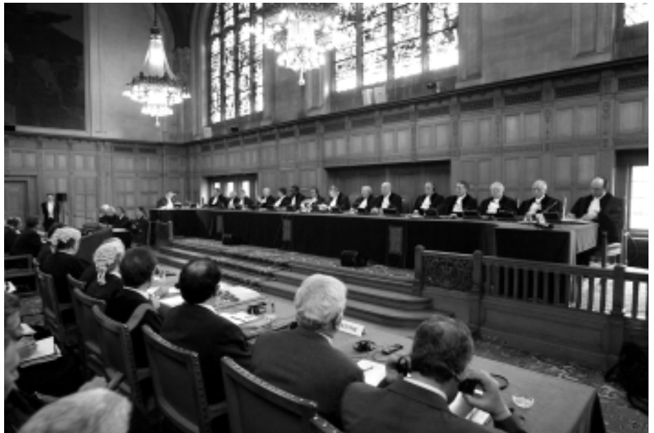
Vom 23. bis zum 25. Februar 2004 fand die Anhörung über die israelische Sperranlage vor dem Internationalen Gerichtshof in Den Haag statt. Die UNO-Vollversammlung hatte um ein Gutachten gebeten, aber nur wenige Länder trugen hier vor. Die EU-Länder, die USA und selbst Israel begnügten sich mit schriftlichen Stellungnahmen. Eine Entscheidung wird Mitte Juli 2004 erwartet.

Eine erste Gruppe von Einwänden betrifft die Fairness des Verfahrens. Das Verfahren sei nicht ausgewogen, da es nur einen Teilkomplex des Problems behandle und andere wesentliche Gesichtspunkte, insbesondere die terroristische Bedrohung gegen Israel ausklammere. Darauf kann man zunächst einmal ganz formal antworten, dass es eine Entscheidung der Generalversammlung ist, über welche Fragen sie den Rechtsrat des Gerichtshofs in Anspruch nehmen will. Diese Entscheidung ist vom Gerichtshof nicht zu hinterfragen. Jenseits dieses formalen Arguments trifft der Einwand jedoch in der Sache gar nicht zu. Die Frage der Selbstmordattentate war und ist Be-