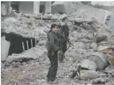
Friedensgutachten 2015 Institut für Friedensforschung und Konfliktforschung (IFPK) Institut für Friedensforschung und Sicherheitspolitik an der Universität Hamburg (IFM) Hessische Stiftung Friedens- und Konfliktforschung (HSFK) Bonn International Centre for Conversion (BICC) Forschungsstelle der Evangelischen Studiengemeinschaft (ESG) LIT