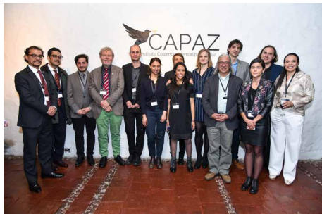
Teilnehmerinnen und Teilnehmer der Direktoriumssitzung in Bogotá (Foto: Instituto Capaz).