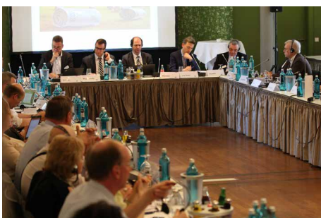
Die 21. Schlangenbader Gespräche.