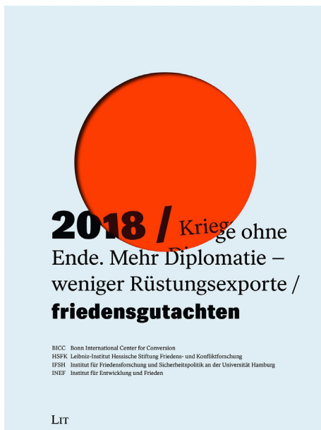
Das Friedensgutachten – 2018 in neuem Format und Design (Coverfoto)