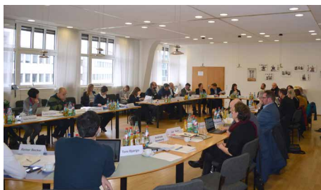
Teilnehmerinnen und Teilnehmer m Autorenworkshop an der HSFK.