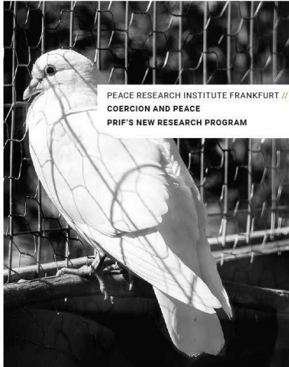
PRIF Report 2/2018 stellt das neue Forschungsprogramm „Coercion and Peace“ vor (Coverfoto).