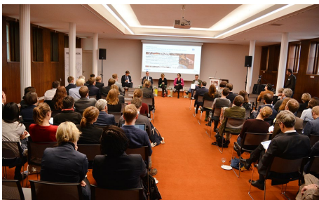
Das Symposium fand in der Leibniz-Gemeinschaft in Berlin statt.