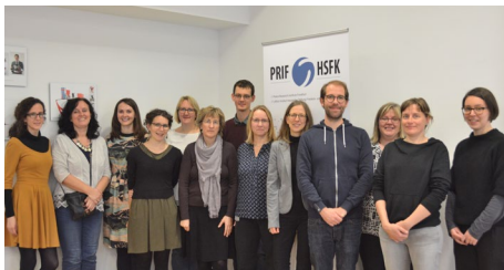
Die Teilnehmer/innen des Workshops