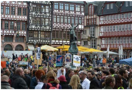
Der Science March endete mit einer Kundgebung am Frankfurter Römer