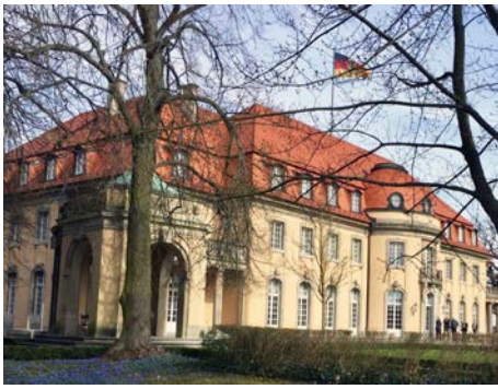
Der Workshop fand in der Villa Borsig in Berlin statt.