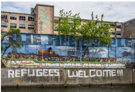
Refugees welcome? HSFK-Studie untersucht Reaktionen auf Unterkünfte für Asylsuchende

On April 22, thousands of people in more than 600 cities around the world joined the Science March to send a strong signal against misrepresentation and defamation of scientific facts, and to stand up for the freedom of science and research. In Frankfurt, around 2,500 people joined the march, among them colleagues of PRIF, and demonstrated in support of scientific findings as indispensable prerequisites of social discourses. PRIF explicitly supported the initiative: “Especially due to our profession as scientists, we must not stand back when facts are increasingly becoming degraded to nothing but opinions”, says Prof. Nicole Deitelhoff, Managing Director of PRIF.