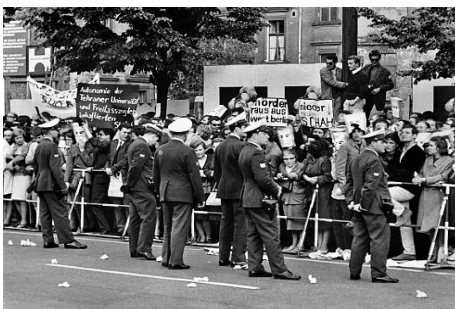
Studentenrevolte 1967/68, West-Berlin