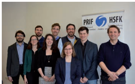
Das eLearning-Team der HSFK