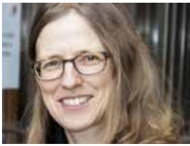
Dr. habil. Birgit Bräuchler