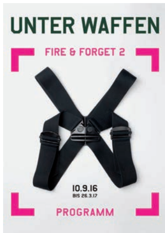
Museum Angewandte Kunst in Frankfurt, Ausstellung „Unter Waffen. Fire and Forget 2“

Start: 7 pm, entrance 6.30pm. The entrance is free. http://bit.ly/2cdOBNj