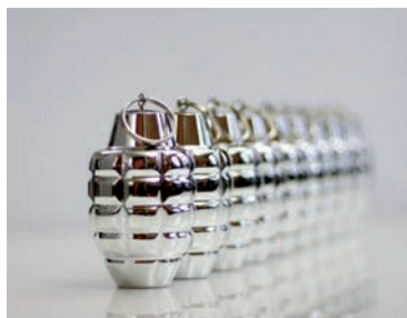
Museum Angewandte Kunst in Frankfurt, Ausstellung „Unter Waffen. Fire and Forget 2“, XMAS Declarations. Grenades for your xmas tree