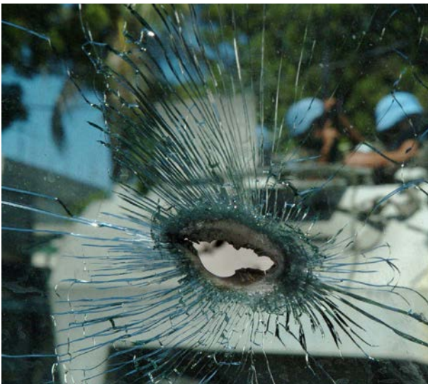
Von Kugeln durchlöcherter Auto der haitianischen Polizei am 26.10.2004 in Port-au-Prince, Haiti. Im Hintergrund ein Tankwagen der UN, der von Anhängern Aristides angegriffen wird.

Sogenannte humanitäre militärische Interventionen verfolgen den erklärten Anspruch, Menschen im Zielland vor Gewalt zu schützen. Viele halten dieses Schutzversprechen für unglaubwürdig, erleben doch die meisten Konflikte keine humanitäre Intervention. Dieses Spotlight erörtert, wo solche Operationen stattfinden oder ausbleiben. Nähe zu westlichen Staaten und Vorkommen von Rohstoffen geben nicht den Ausschlag. Vielmehr treten humanitäre Interventionen verstärkt auf, wenn ein großer Interventionsbedarf, angezeigt durch hohe Opferzahlen, einhergeht mit plausiblen Chancen darauf, mit dem Eingreifen die Gewalt zu stoppen oder einzudämmen.