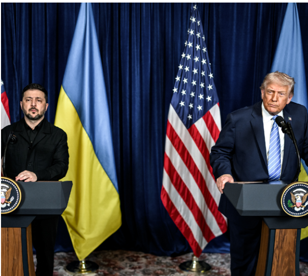
Gemeinsame Pressekonferenz von Donald Trump und Wolodymyr Selenskyj in Mar-a-Lago, Palm Beach, Florida am 28. Dezember 2025.

Politik muss die Zukunft vorhersagen. Genauer: Strategien zur Lösung schwerwiegender Probleme sollten auf umfassenden und wohlgedachten Einschätzungen aufbauen – zur Wahrscheinlichkeit zukünftiger Entwicklungen, zu Risiken und zu Chancen. Zentral für solche Einschätzungen sind wissenschaftliche Analysen – auch und gerade bei politisch weitreichenden Phänomenen wie Krieg und Frieden. Dieses Spotlight zeigt daher am Beispiel vergangener Prognosen und Empfehlungen zum Russland-Ukraine-Krieg auf, wie Wissenschaft zur besseren geopolitischen Entscheidungsfindung beitragen kann, wo sie an Grenzen stößt und wo ihre Potenziale liegen.