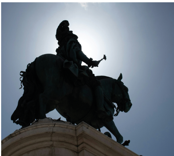
Machtdemonstration mit Schattenseiten: In vielen Städten erinnern Reiterstandbilder an vergangene Großmachtpolitik.

Nach Jahren der Globalisierung scheint die Welt in die Logik der Macht zurückzufallen. Die Kritik an „naiver“ Globalisierungspolitik hat Hochkonjunktur. Zunehmend wird auf nüchterne Machtpolitik gesetzt, auf Unabhängigkeit und militärische Stärke statt auf Vernetzung und internationale Organisation. Doch die Hinwendung zur Machtpolitik droht die Fehler der Globalisierungspolitik unter anderen Vorzeichen zu wiederholen. Im sicheren Glauben die Welt nun verstanden zu haben, wird „alternativlose“ Politik betrieben, die ihre eigenen Risiken übersieht und die Welt so auf Dauer unsicherer zu machen droht.