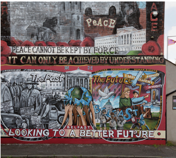
Politische Wandmalerei, dem Frieden gewidmet, Newtownards Road, Belfast.

Die Welt wäre weit friedlicher, würden sich viele bereits beendete Bürgerkriege nicht ein weiteres Mal entzünden. Seit geraumer Zeit machen Bürgerkriege einen Großteil des Konfliktgeschehens aus, und bei vielen von ihnen handelt es sich um wiederausgebrochene Kriege. Das wirft die Frage auf, welche Faktoren den Frieden stabilisieren oder eine erneute Eskalation begünstigen. Dem ging ein PRIF-Projekt zu 48 beendeten Bürgerkriegen in allen Teilen der Welt nach. Innerhalb weniger Jahre erlebten 17 von diesen einen Rückfall in kriegerische Gewalt.