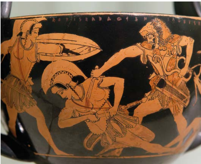
Herakles im Kampf gegen die Amazonen, ca. 490-480 v. Chr. Sammlung von Giampietro Campana di Cavelli/ Musées royaux d'Art et d'Histoire, Brüssel.

In Politik, Medien und öffentlicher Debatte begegnen uns immer wieder Konfliktmythen. Bei ihnen handelt es sich nicht um überlieferte Erzählungen aus vergangenen Zeiten, sondern verbreitete falsche Vorstellungen von Frieden und Konflikt. An vielen Konfliktmythen ist nicht alles falsch. Sie dehnen aber Aussagen so sehr über deren Geltungsbereich hinaus, dass sie nicht mehr zutreffen. Sie legen einen bestimmten Umgang mit Konflikten nahe und beeinflussen so Debatten und Entscheidungen. Dieser Beitrag versucht, einige falsche Vorstellungen geradezurücken.