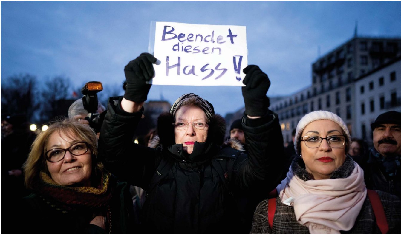
Mahnwache am Brandenburger Tor für die Opfer des Anschlags in Hanau am 19. Februar 2020. Ein 43-Jähriger ermordete im hessischen Hanau zehn Menschen und erschoss sich dann selbst.

auf, welche finanziellen und zeitlichen Ressourcen eine sinnvolle Evaluation erfordert. Die unterschiedlichen Professionen der beteiligten Personen (Rechts- und Sozialwissenschaften, Psychologie, Pädagogik, soziale Arbeit, sicherheitsbehördliche Kontexte etc.) fokussieren zudem auf unterschiedliche theoretische und methodische Ansätze. So entsteht ein Spannungsfeld zwischen dem gemeinsamen Ziel der Qualitätssicherung einerseits und der Vielfalt in der Landschaft andererseits. Gleichzeitig birgt die Bandbreite an Perspektiven und Expertisen jedoch großes Potenzial, um diese Herausforderung erfolgreich zu bewältigen. Welche Rahmenbedingungen können helfen, dieses Potenzial nutzbar zu machen?