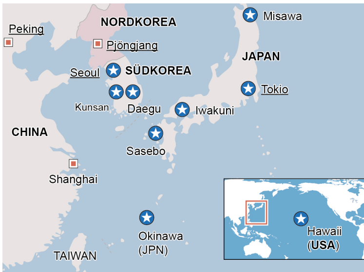
US-Stützpunkte in Südkorea und der Region

Hitlers oder Saddam Husseins die Unbesiegbarkeit seiner Streitkräfte oder gar die unbegrenzte Schlagkraft seines Kernwaffenarsenals vor, weil sie fürchten, bei realistischer Darstellung das übliche Schicksal der Überbringer schlechter Nachrichten zu erleiden? Nach einem aktuellen Reisebericht des US-Journalisten Nicholas Kristof, soll die Bevölkerung Nordkoreas jedenfalls an den Sieg über die USA im Atomkrieg glauben (New York Times, 5.10.2017, http://nyti.ms/2yJAy7F ).