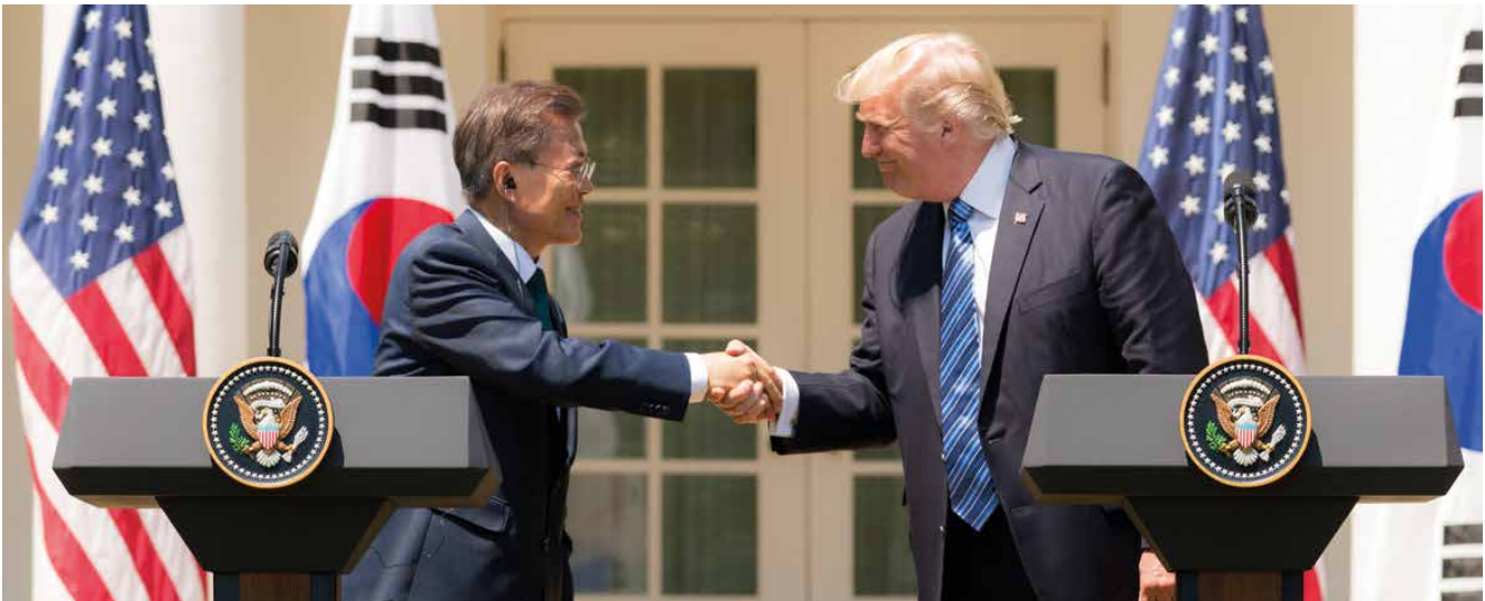
Moon mit US-Präsident Trump vor dem Weißen Haus

Die Spaltung der amerikanischen Gesellschaft und die Radikalisierung der republikanischen Partei lassen kaum Änderung zum Besseren erhoffen.