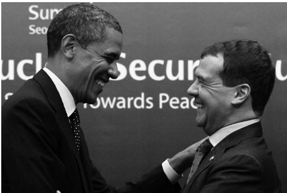
Erfolgreich war Obama auch in seinen Bemühungen, die eingefrorenen Beziehungen zu Russland wiederzubeleben. Hier auf dem Foto ist er mit dem ehemaligen russischen Präsidenten Medwedjew zu sehen am Rande des zweiten Nuclear Security Summit in Südkorea im März 2012. Noch mehr Staaten als beim ersten Treffen 2010 nahmen an diesem von Obama initiierten Gipfel teil, und sieben weitere Staaten sagten zu, ihre Bestände an waffenfähigem Uran aufzugeben.

Die Nuclear Posture Review vom April 2010 stand im Zeichen einer Verminderung der Bedeutung von Nuklearwaffen für die nationale Sicherheitsstrategie, wenngleich nicht so sehr wie von Abrüstungsbefürwortern erhofft. Vielmehr war sie ein Kompromiss am Ende eines langen bürokratischen Prozesses. Eine Gruppe um Vizepräsident Biden wollte in der NPR den grundsätzlichen Verzicht auf den Ersteininsatz („no first use“) festschreiben lassen. Außerdem strebten sie den Wegfall eines der Standbeine der Triade (damit ist die Aufteilung der nuklearen Streitkräfte auf drei Trägersysteme gemeint: Interkontinentalraketen, U-Boot-gestützte Raketen und Bomber) und dadurch insgesamt mehr Raum für Abrüstung an. Eine an-