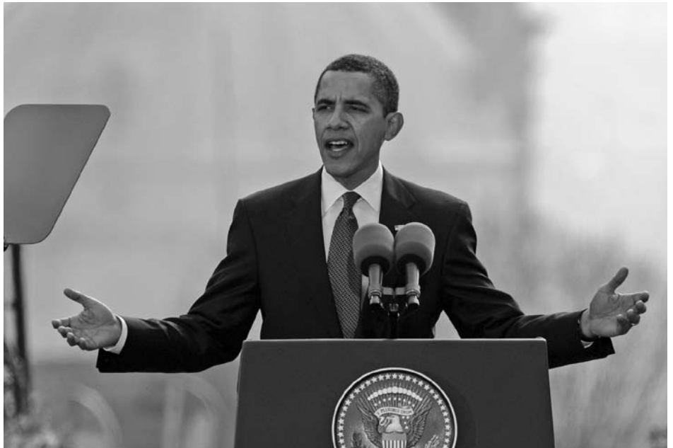
April 2009: Präsident Obama hält seine legendäre Rede in Prag, in der er seinen ehrgeizigen Plan darlegt, die Welt von allen Atomwaffen zu befreien. Dafür sollte er später sogar den Friedensnobelpreis bekommen. Mit seinem erfolgreichen Wahlkampfslogan „Yes we can“ forderte er die Welt auf, sich von der nuklearen Bedrohung zu befreien. Was ist aus seinen hochgesteckten Zielen geworden?

Marco Fey zieht nach vier Jahren Bilanz zur Nuklearwaffenpolitik Obamas und sie fällt positiv aus, auch wenn mancher Fortschritt mehr Zeit brauchte als ursprünglich gehofft. Und deutlich wird am Ende seiner Analyse, dass viele Weichen gestellt wurden. Noch deutlicher allerdings wird die große Sorge, dass dieser längst überfällige Prozess durch die Wahl Mitt Romneys wieder zum Stillstand gebracht würde. Karin Hammer