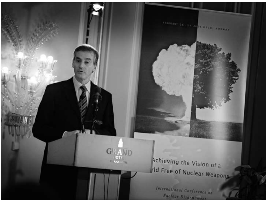
Einzig Norwegen griff die Initiative der vier Amerikaner entschlossen auf und lud zu einer internationalen Abrüstungskonferenz in Oslo ein vom 26. bis zum 27. Februar 2008. Auf dem Bild zu sehen ist der norwegische Außenminister Jonas Gahr Støre während seiner Eröffnungsrede.