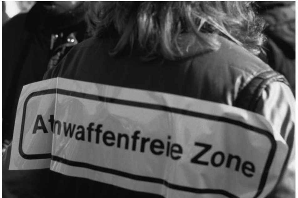
Öffentliche Proteste sind selten geworden, vielen ist es nicht mehr bewusst, wieviele Nuklearwaffen in Europa nach wie vor stationiert sind. Doch Umfragen zeigen, dass die Mehrzahl der Europäer die Stationierung von Atomwaffen in Europa nach wie vor ablehnt.