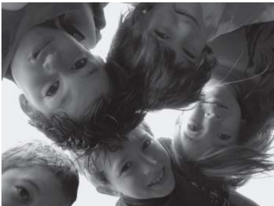
Kinder an die Macht? Kinder sollten mitentscheiden können, wenn es um ihre Interessen geht. Doch die Fähigkeit zur Teilhabe und Verantwortung ist nicht angeboren – sie muss erlernt werden. Viele Kindergärten haben sich des Themas „Erziehung zu Demokratie“ bereits angenommen.