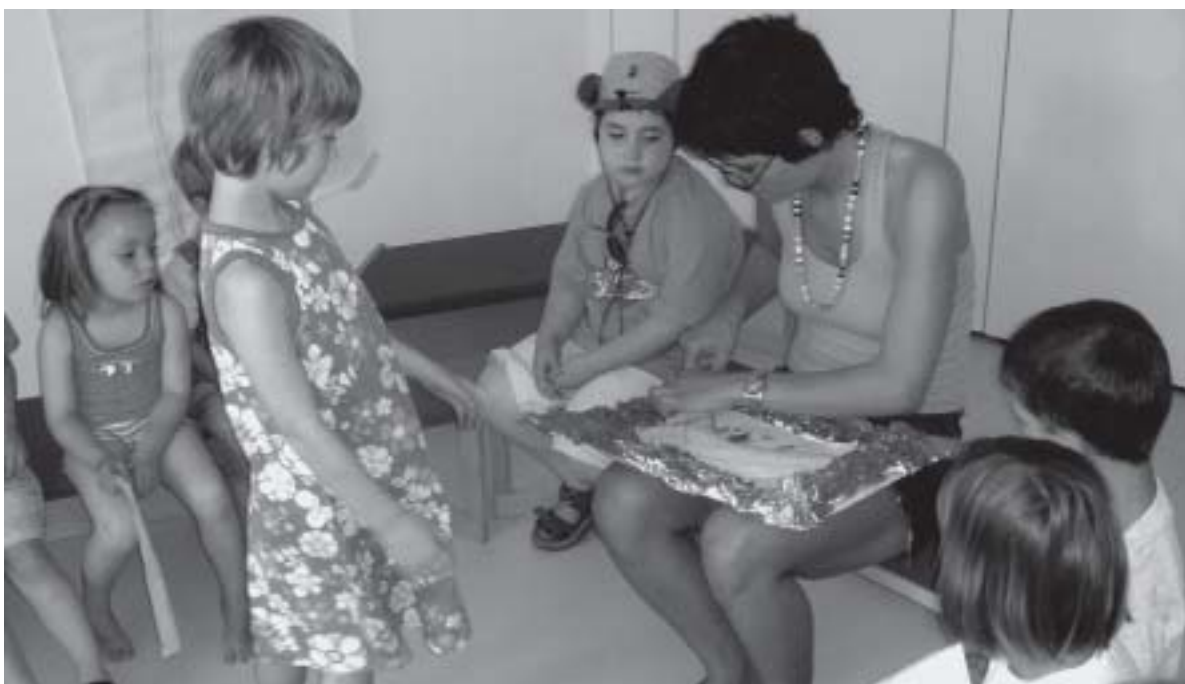
... (6) Das Bild, für das sich die Mehrheit entschieden hat, wird zum Aufhängen vorbereitet und mit einem Rahmen versehen. Das Ergebnis der Demokratie-Werkstatt hängt künftig für alle sichtbar im Eingangsbereich und ihr Verlauf wird auch dadurch allen in Erinnerung bleiben.

Dieses und andere Konzepte sind allerdings bei genauerer Betrachtung zu wenig präzise, um Anhaltspunkte dafür zu geben, wie die Verfahren im Einzelnen und vor Ort in pädagogische Settings und Interventionen