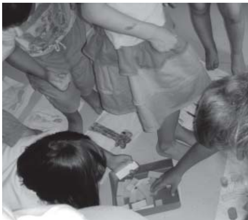
...(3) Es kommt zur Abstimmung: Jedes Kind legt auf das Bild seiner Wahl einen Bauklötzchen...